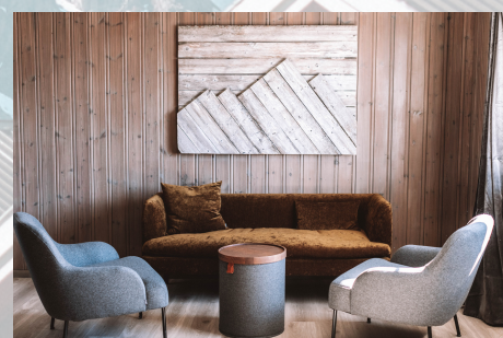
SUPERIOR HOTELLROOM 1400 NOK

Det kreves minimum 60 gjester . Dessuten må alle hotellrom og minimum 10 hytter bestilles for bryllupsgjestene for et opphold på minimum to netter med frokostservering hver dag.