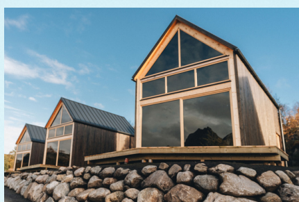
TOP ROW CABINS 3200 NOK