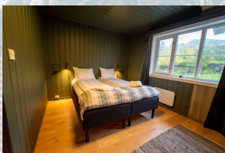
STANDARD HOTELLROM 1300 NOK