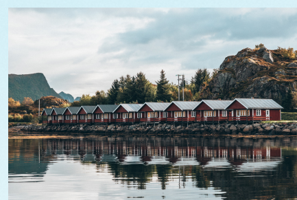
RORBUER 2400 NOK